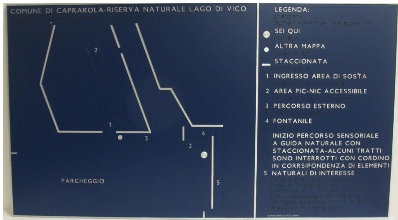
Esempio di "mappa di luogo"

Le "mappe di luogo" , invece, devono essere realizzate laddove il loro scopo sia proprio quello di far conoscere in tal modo la disposizione dei vari elementi, la forma del locale o la composizione dell'ambiente naturale. Così, in una palestra non vi saranno piste tattili che conducono ai vari attrezzi, ma una rappresentazione completa dell'andamento regolare o irregolare delle pareti e la disposizione, lungo di esse o a distanza, dei vari attrezzi. In una chiesa, per farne comprendere la complessità e l'articolazione, la mappa di luogo riprodurrà tutte le cappelle laterali con la loro forma e dimensione, anche se non sono aperte al pubblico, il transetto e l'altare maggiore, per consentire al cieco di formarsi un'immagine mentale della struttura. Anche le mappe in un sentiero naturalistico, oltre a mostrare lo svolgimento più o meno tortuoso di esso, dovranno indicare la presenza di elementi del tutto irraggiungibili, come una vallata con un lago o una catena di monti, per consentire al non vedente di immedesimarsi nell'ambiente e di riempire con l'immaginazione il vuoto lasciato dalla mancanza di immagini.