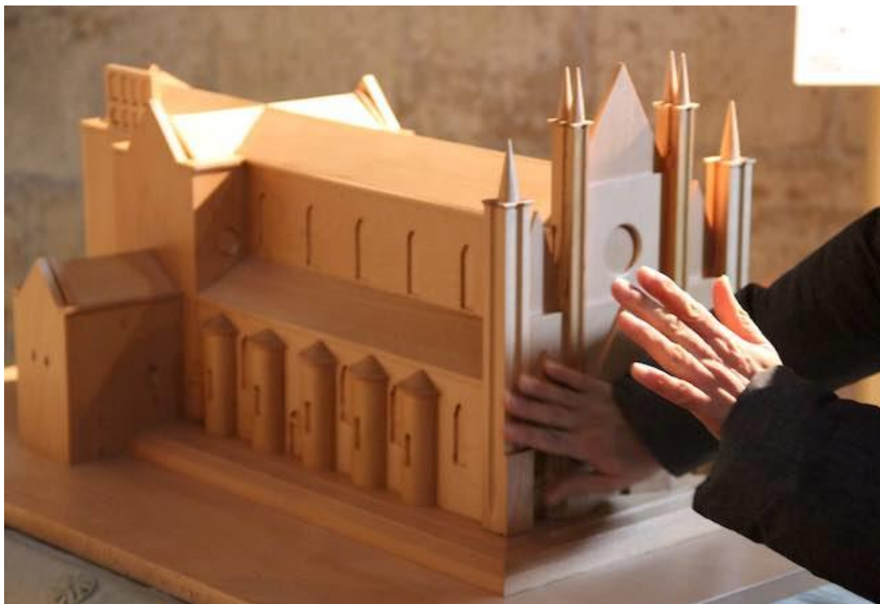
Esempio di "plastico tridimensionale"

Conseguentemente il presente disciplinare si occuperà essenzialmente delle mappe di percorso.